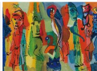
ヘンリー・ミラー(行列)(原画)1955年