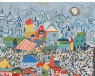
ヘンリー・ミラー(北アフリカ風)(久保エディション)1974年