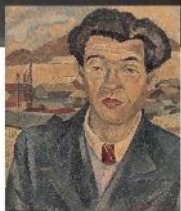
北川民次(久保貞次郎肖像)1949年